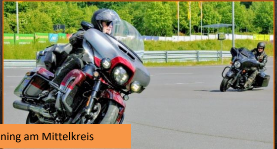
Schräglagen-Training am Mittelkreis

Übung macht den Meister – so ist's auch beim Training mit den Harleys! Es reicht nicht, „hab ich schon mal gemacht...“ Zur Erinnerung, Messi , der wohl beste Fußballer – keiner trainiert so häufig und viel wie er! Das ADAC-Training hilft dabei Situationen zu erlernen, die du hoffentlich nie auf der Straße erlebst. Wenn aber doch, dann hast du in deinem Gehirn das „Programm zur Bewältigung“ abrufbar hinterlegt! Eines ist klar... „Wer sich nicht verbessern will – hat bereits aufgehört gut zu sein!“