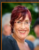
Doris Hesse Photographer