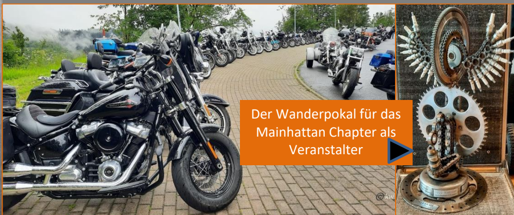
Bild oben: Aufstellung der Bikes vor der Ausfahrt am Samstag! Und hier jetzt 5 Kleeblatt-Chapter

Unserem Sponsoring Dealer gehören die 5 Chapter Hannover – Wiesbaden – Wetzlar – Frankfurt – jetzt neu, auch Saarland. Jedes Jahr richtet ein anderes Chapter das „Kleeblatt-Treffen“ aus! 2024 war das Mainhattan Chapter dran – da gleichzeitig das 30-jährige Jubiläum anstand machten wir das in 1 Veranstaltung. Das Ringberg-Hotel in Suhl war unsere Location. Über 200 Member (Titelfoto) in bester Feierlaune!